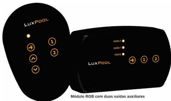
Módulo RGB com duas saídas auxiliares

O módulo de controle RGB com duas saídas auxiliares LuxPool foi desenvolvido para automatizar a sua piscina. O módulo dispõe de uma saída de iluminação RGB e duas saídas auxiliares para acionamento de bombas, podendo acionar a bomba do filtro, cascata, hidromassagem, borda infinita entre outros.